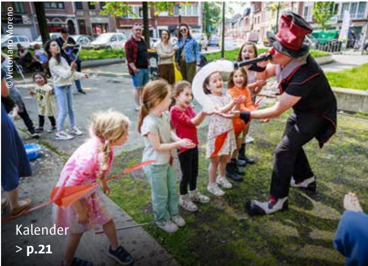
Kalender > p.21