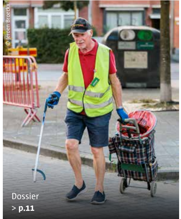
Dossier > p.11