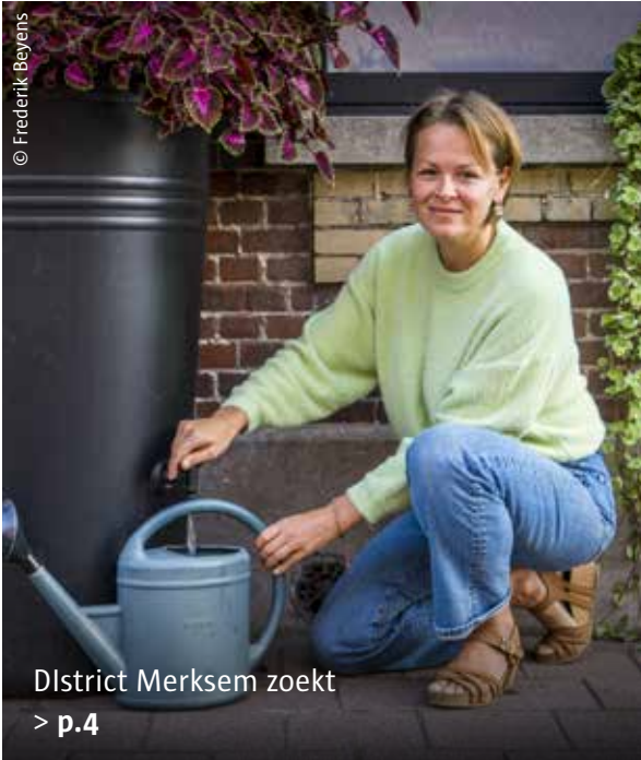
District Merksem zoekt > p.4